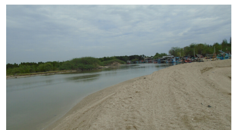
โครงการขุดลอกคลอง หมู่ 5