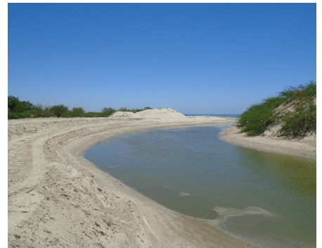
โครงการขุดลอกคลอง หมู่ 1-2