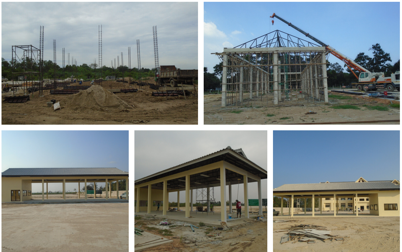
โครงการก่อสร้างโรงจอดรถเทศบาลตำบลบางเก่า