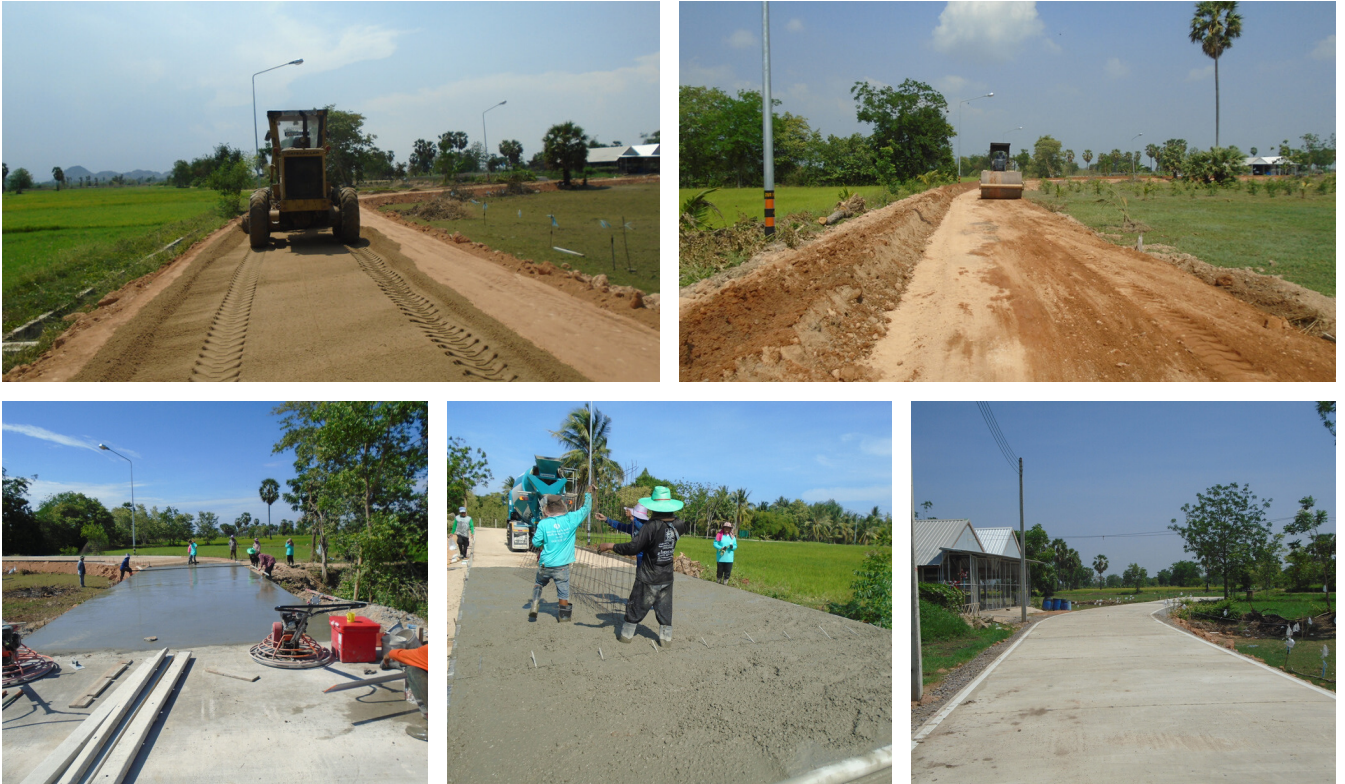
โครงการก่อสร้างนาป่าช้า หมู่ 8