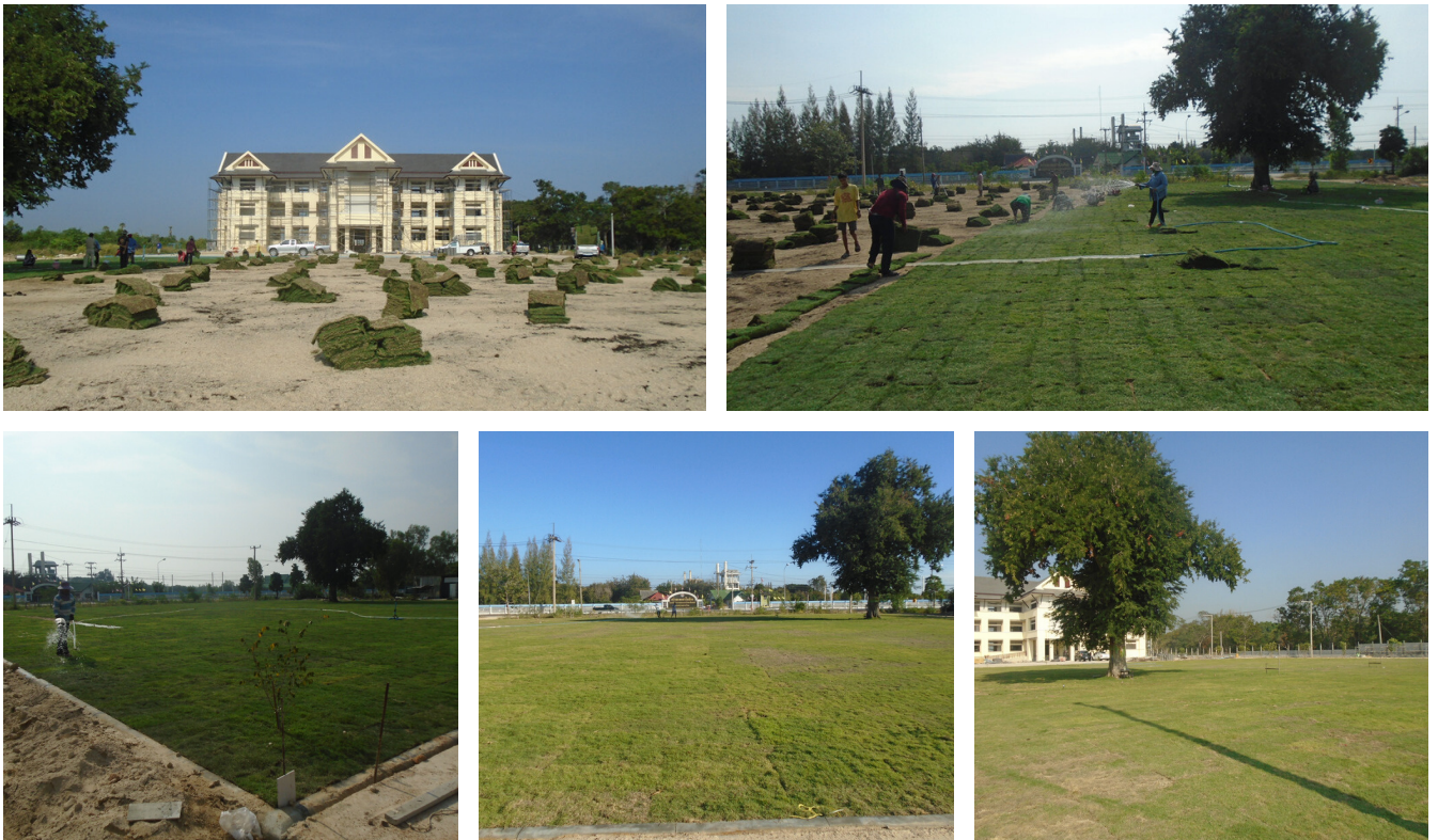
โครงการปรับปรุงภูมิทัศน์เทศบาลตำบลบางเก่า