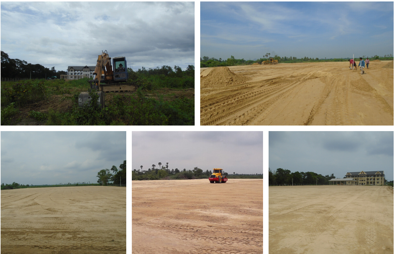
โครงการถมดินเทศบาลตำบลบางเก่า